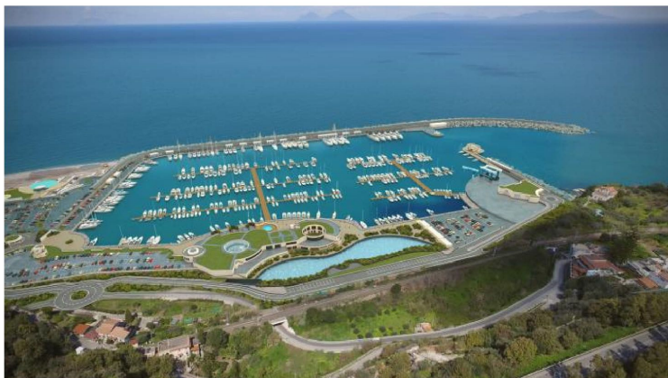
Il rendering di Capo d'Orlando Marina, con sullo sfondo il profilo delle Eolie

Capo d'Orlando- Ancora poche settimane e Capo d'Orlando Marina, nuovo porto turistico della rete MPN Marinas, sarà ufficialmente inaugurato. A giugno è in programma l'apertura ufficiale e a luglio l'inaugurazione. Grazie all'ubicazione strategica proprio di fronte alle Eolie e all'offerta di servizi nautici e di accoglienza degni di un vero e proprio resort sul mare, il nuovo marina orlandino rappresenterà una delle strutture di riferimento per la portualità turistica siciliana.